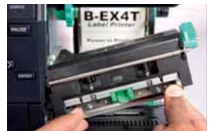
La testina sostituibile senza attrezzi permette una notevole riduzione del tempo di intervento